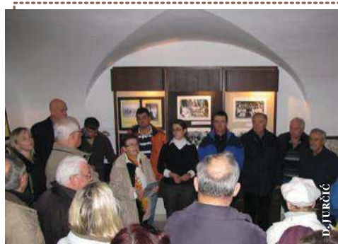
Kastavska Noć muzeja u znaku Srdoča

Srdoči, ističu u udruzi, povijesno pripadaju Kastavštini pa je ova izložba bila u funkciji potvrde te pripadnosti i povezanosti koja i danas traje.