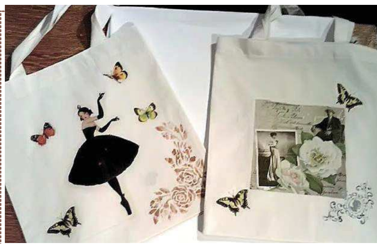
Platnene torbe u tehnici 'decoupage', rad članova 'Mavrice'

U suradnji s Pomorskim i povijesnim muzejem Hrvatskog primorja u Muzejskoj zbirci Kastavštine za Noć muzeja 31. siječnja 2014. priređena je izložba pod nazivom Srdoči kao dio Kastavštine . Udruga Mavrica Srdoči, tom je prilikom kroz prikupljene fotografije i zapise predstavila povijest mjesta Srdoči.