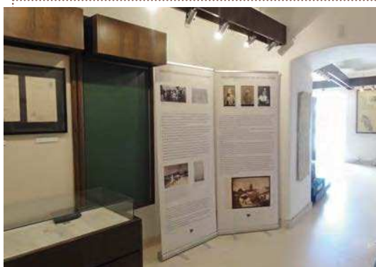
Prva izložba nakon preuređenja – Crtice iz povijesti školstva Grada Kastva